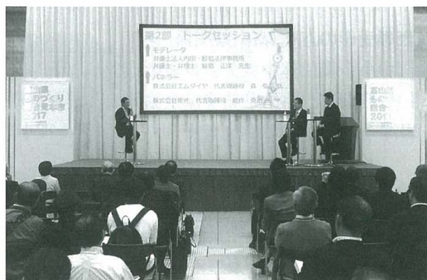
トークセッションの様子