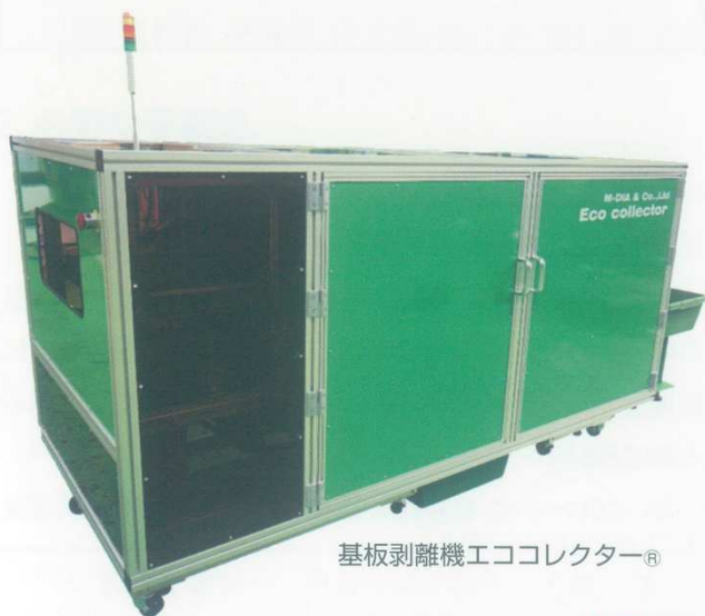
基板剥離機エココレクター®

本設備に留まらず、弊社では独自技術を活かした様々なリサイクル機械を製造・販売しております。リサイクルに関してお困りごとなどがございましたら、お気軽にご連絡くださいませ。